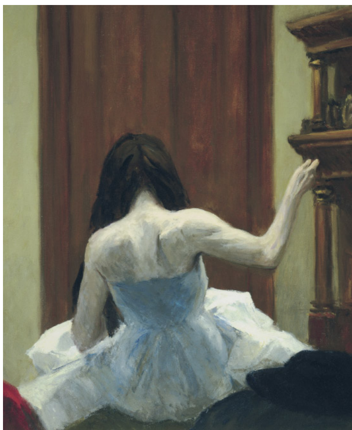
New York Interior, (Interno a New York) , 1921 circa Olio su tela, 61,6 x 74,3 cm, New York, Whitney Museum of American Art, Lascito di Josephine Nivison Hopper, 70.1200 © Heirs of Josephine N. Hopper, licensed by the Whitney Museum of American Art. - Fotografia di Robert M. Mates

saranno utilizzati per realizzare i manifesti pubblicitari, cosicché per la prima volta il pubblico dei musei diviene in queste due città anche parte integrante e testimonial assoluto del progetto espositivo stesso. Un'iniziativa così originale e moderna non poteva che trovare terreno fertile e ragione d'essere nell'ambito della rassegna dedicata al "realismo hopperiano", agli scenari ed ai personaggi del "pittore del quotidiano" per eccellenza. Edward Hopper (nato a Nyack, vicino New York, nel 1882) fu indissolubilmente legato all'arte figurativa fin dalla giovane età: già a 18 anni entrò alla New York of Illustrating e un anno dopo