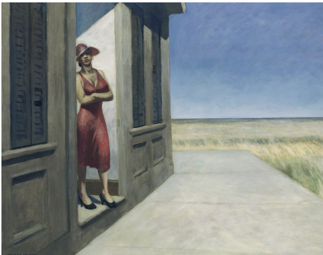
South Carolina Morning, (Mattino in South Carolina), 1955 - Olio su tela, 77,63 × 102,24 cm - New York, Whitney Museum of American Art Donato in memoria di Otto L. Spaeth dalla sua famiglia, 67.13