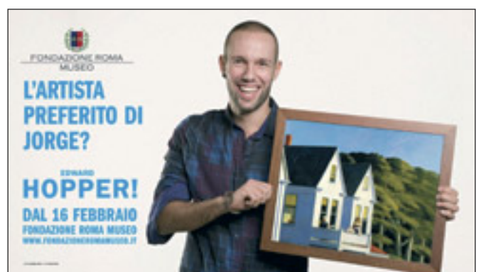
I sei scatti fotografici dello shooting di Roma selezionati per la campagna pubblicitaria su Hopper