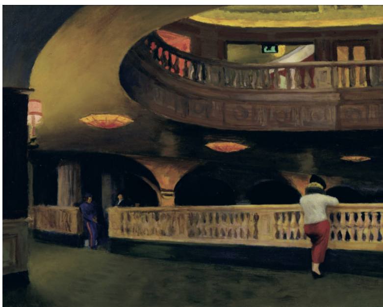
The Sheridan Theatre (Il Cinema Sheridan) , 1937 - Olio su tela, 43,5 x 64,1 cm Newark, New Jersey, The Newark Museum. Lascito del fondo Felix Fuld, 1940

Per il suo trasferimento al Museo della Fondazione Roma, a metà febbraio, la mostra si arricchirà di cinque opere, datate tra il 1921 ed il 1955: si tratta di New York Interior , The Sheridan Theatre , Seven A.M. , Self-Portrait e South Carolina Morning , tutti magnifici esempi per un verso dell'attenzione di Hopper ai dettagli degli ambienti piccolo-bor-